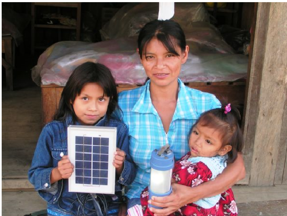
Dank der Kleinkredite kann sich jede Familie eine Solarlampe leisten