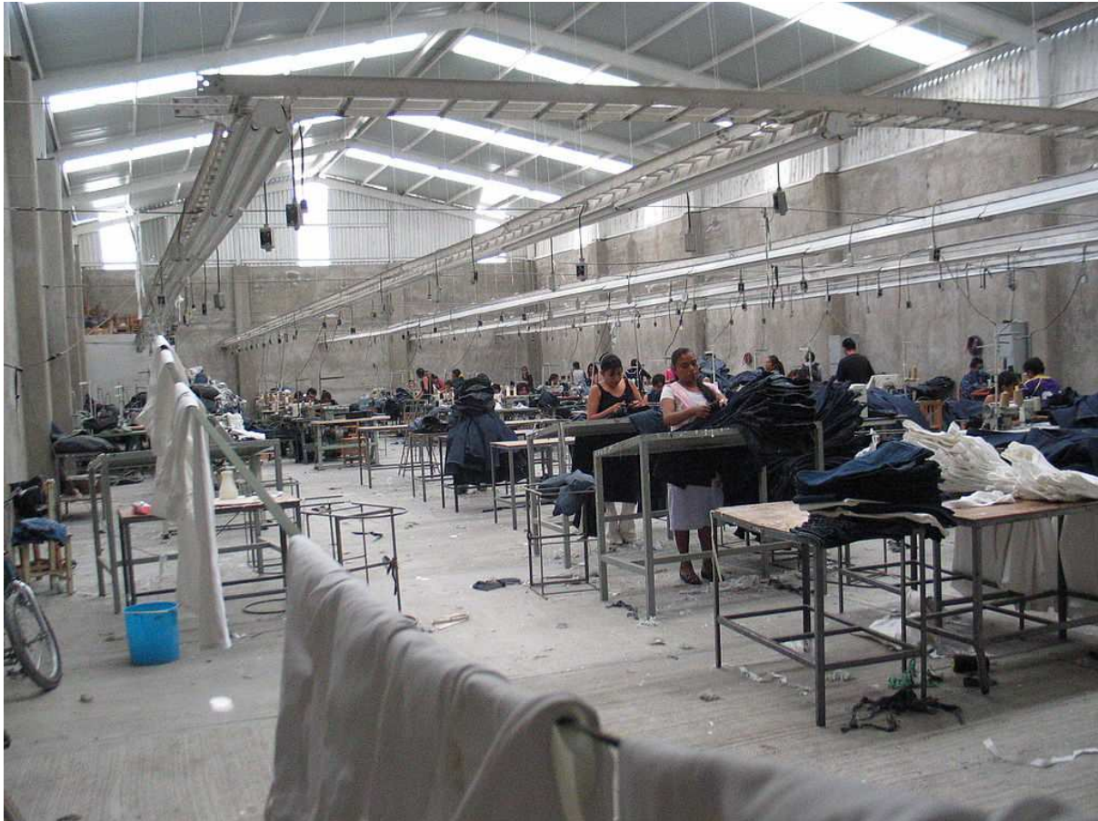
Eine Maquiladora in Mexiko