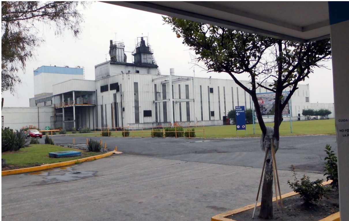
Die Reifenfabrik heute