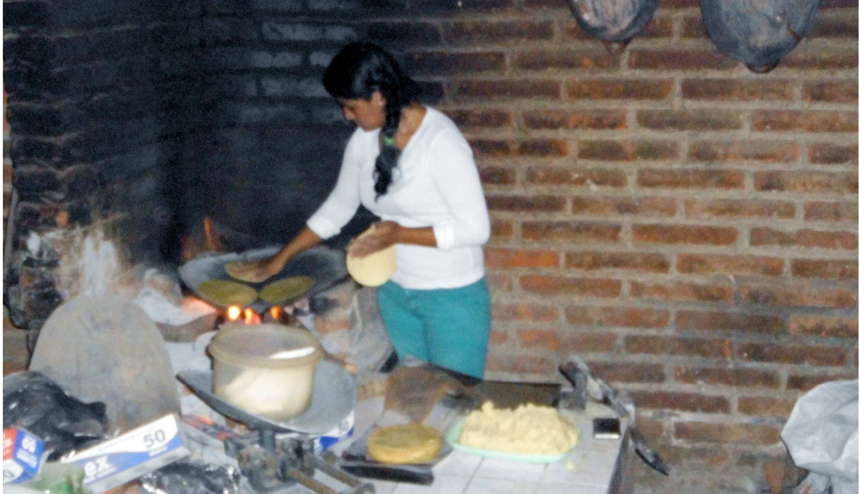
Die meisten Mexikaner kämpfen ums Überleben in der informellen Wirtschaft