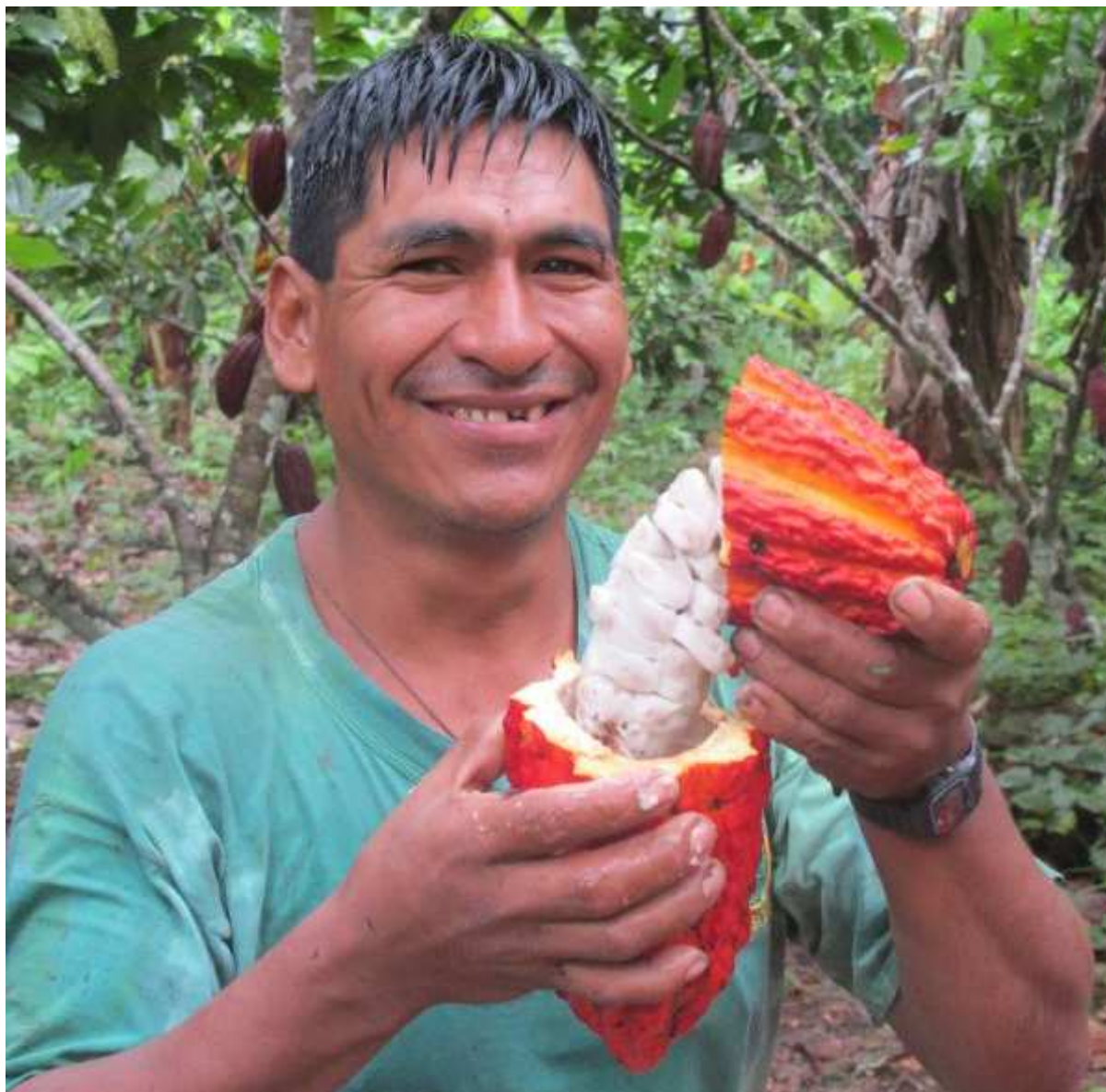
Strenge Qualitätsselektion bei der Ernte